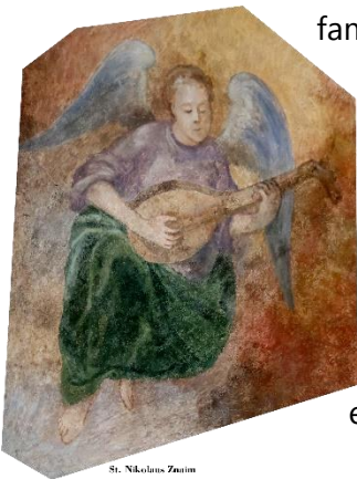
St. Nikolaus Zanon

Für meine Verabschiedung wählten wir im Familiengottesdienstteam das Thema „Gottes Engel behütet dich auf deinem Weg.“ (nach Ps 91,11). Im Bild eines Engels, der Menschen sichtbar werden ließ, die ein Stück unseres Weges mit uns gehen und uns beistehen, und eines langen, bunten Weges zu diesem Engel